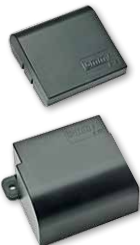
Lommy Eye 3 jaar model IP 33 Afmetingen: 55x52x21 mm

WARM OF KOUD. Is de verwarming aan, wat is de temperatuur in uw vakantiehuis? Waar is uw apparaat – in een warme of koude omgeving, een warme zolder of een koude kelder. De temperatuur geeft het antwoord.